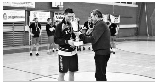
Проглашени најбољи играч, стрелац и голман

пало је Ацовој банди, други је био One team, а треће место је припало екипи Front liners. У конкуренцији пионира до шампионске титуле стигла је домаћа екипа Љуба плус, сребрни су били дечаки из екипе Ком-