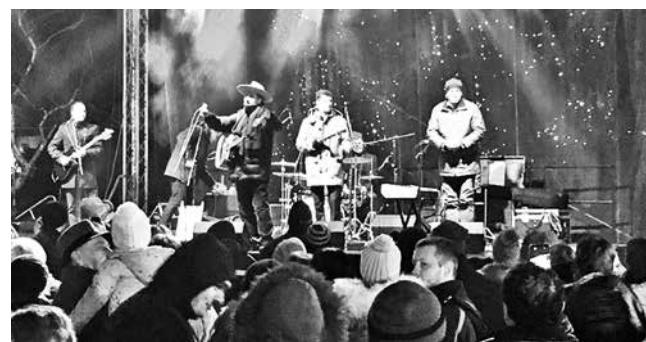
Организатор прослава је локална самоуправа