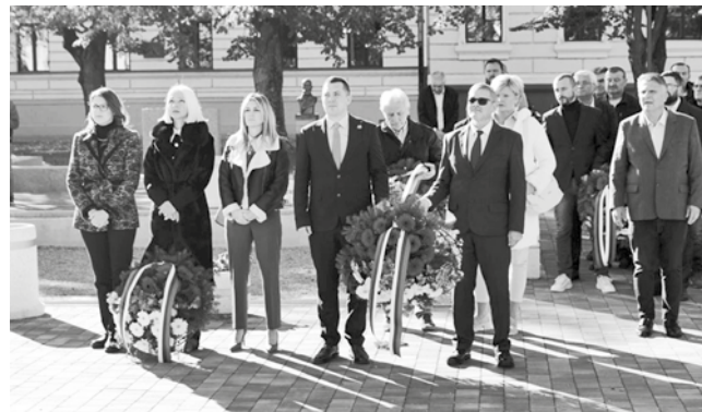
И данас је потребно јединство