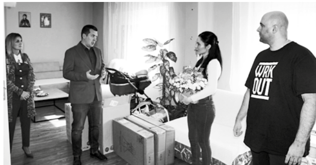
Позив младим брачним паровима