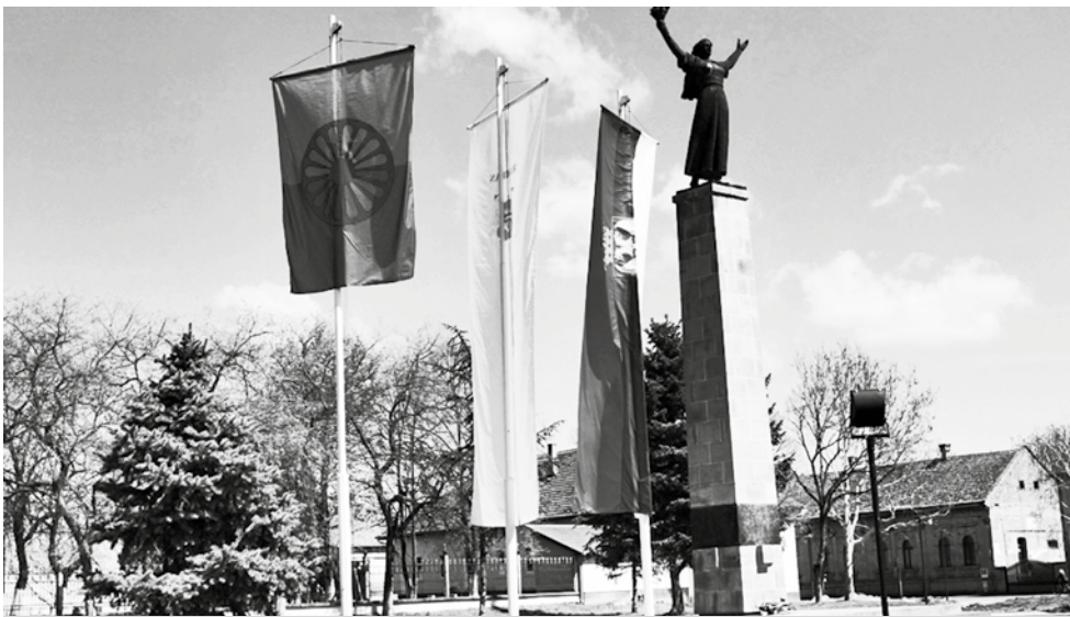
На Тргу слободе 8.априла подигнута и ромска национална заставица

Иначе, о положају Рома и о многим другим темама важним за србобранске Роми разговарало се 8. априла на трибини «Роми о Ромима», у организацији Националног савета, у Скупштини Републике Србије.