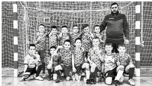
Зимска лига имала је такмичења у четири различите генерацијске категорије