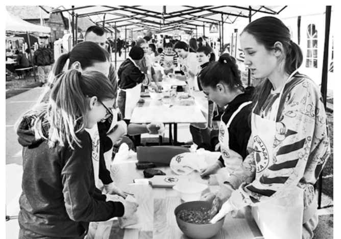
Такмичење младих у прављењу кобасица

» Током првог дана традиционалне манифестације у Турији деца су вешто правила кобасице. На такмичењу младих у прављењу кобасица учествовало је 11 екипа, а победници такмичења за децу у прављењу кобасица, се ни у чему не разликују од оних које праве професионалци годинама. Прво место освојила је „Весела дружина“ из ОШ „Петар Драпшин“, друго место екипа „Надаљска кобасица“ коју су чинили ученици ОШ „Момчило Тапавица“ из Надаља, а треће гимназијалци „Светозара Милетића“. Победницама је као награда припало десетодневни летовање у Сутомору.