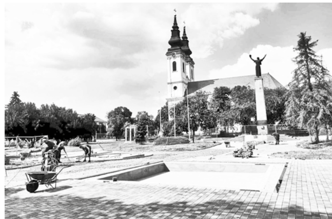
„Циљ – богатија општина и задовољни грађани“

„Имаћемо нови пијачни плато од 2.000 квадратних метара, иза retail центра. Већ смо на 50 одсто радова и надам се да ће за нешто више од месец дана нова