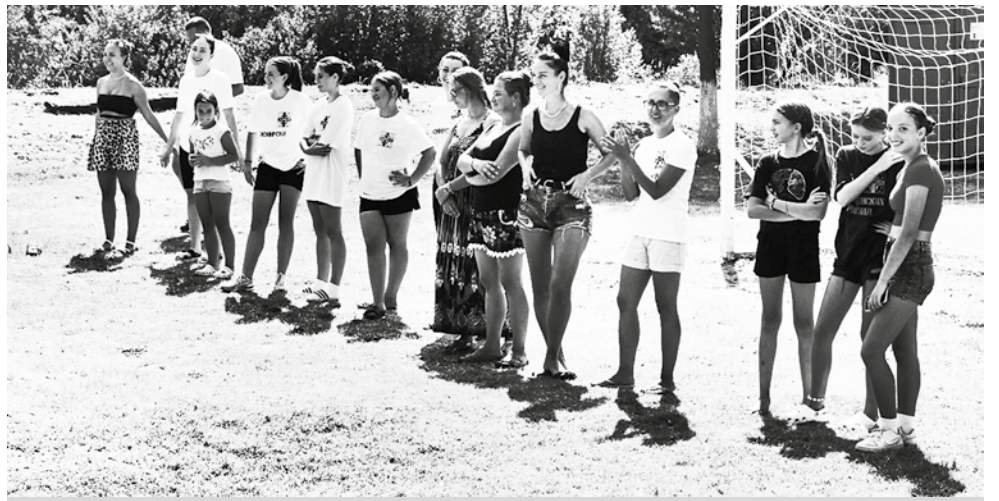
Вашаришћански турнир је окупио 6 екипа