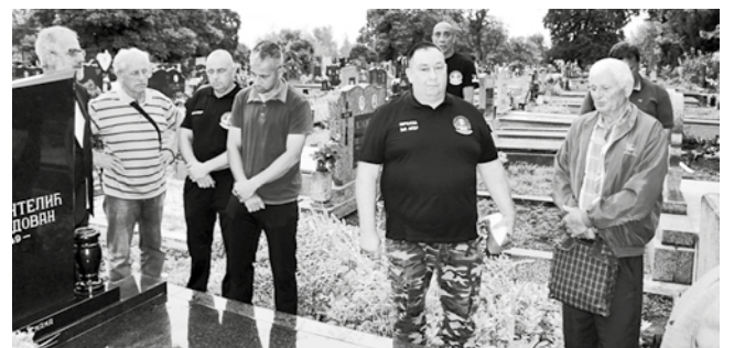
Хероји који су нас бранили у најтежим тренуцима