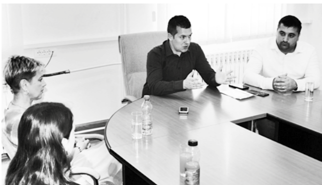
Најбољи ђаци су:

Приликом пријема ученицима генерације уручени су вредни поклони - таблет рачунари, књиге и пенкала.