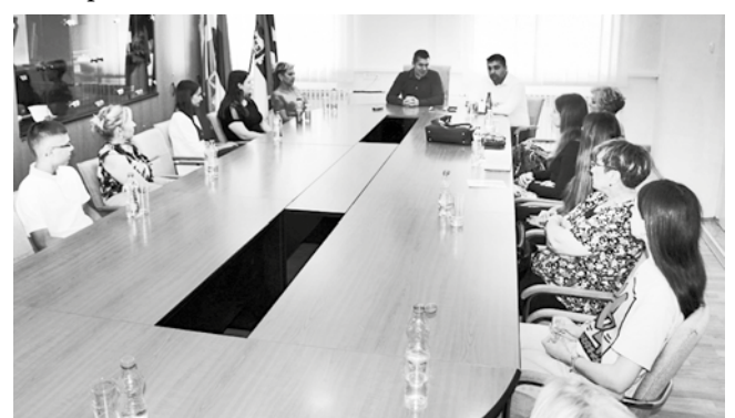
Нови вид подршке