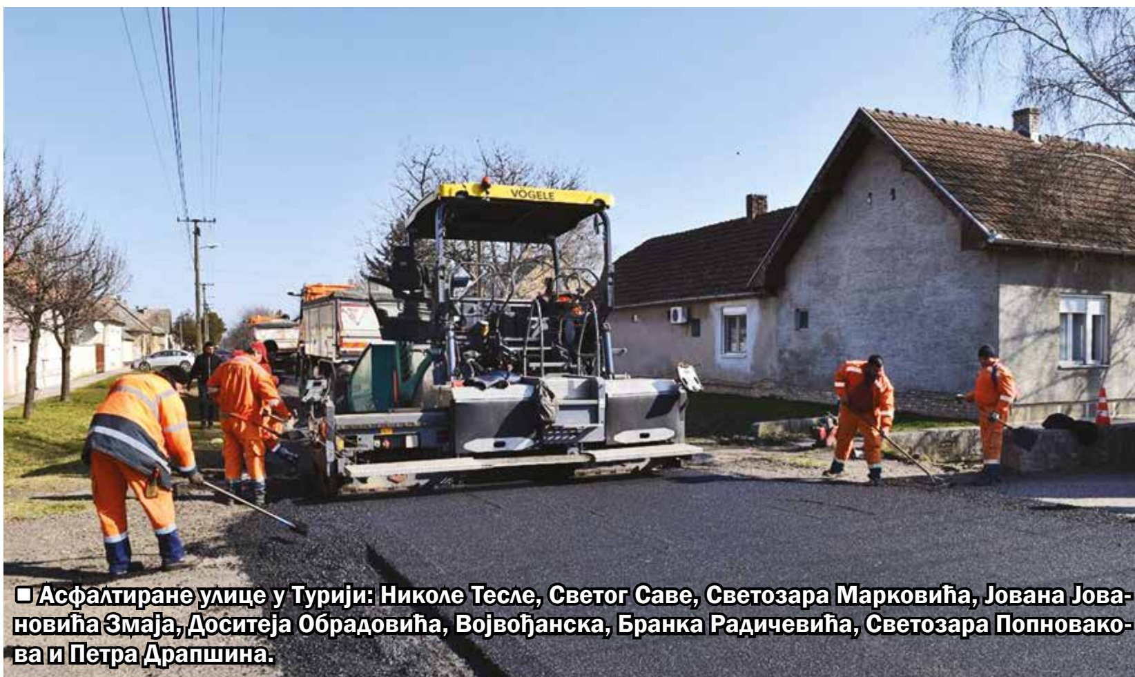
■ Асфалтиране улице у Турији: Николе Тесле, Светог Саве, Светозара Марковића, Јована Јовановића Змаја, Доситеја Обрадовића, Војвођанска, Бранка Радичевића, Светозара Попновакова и Петра Драпшина.