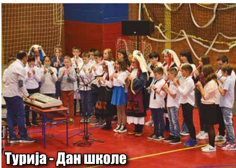
Турија - Дан школе