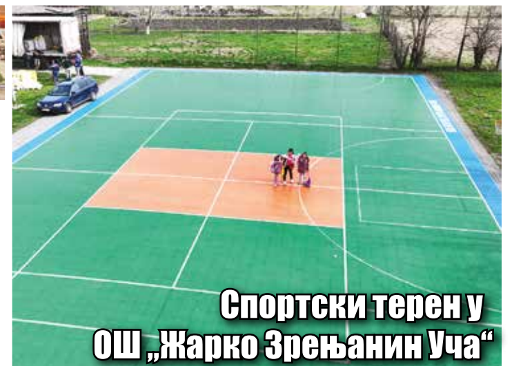
Спортски терен у ОШ „Жарко Зрењанин Уча“

■ У кратком року Основна школа „Жарко Зрењанин Уча“ у Надаљу у потпуности је реновирана, од темеља до крова. Само за ова два важна пројекта реконструкције и модернизације, Покрајинска влада је издвојила 19 милиона динара, а ова цифра расте на чак 41 милион динара ако се као улагачи у обнову и унапређење услова за школовање укључе и Општина Србобран и компанија НИС. Замењен је гасни kotaо, изграђен нови спортски терен у дворишту школе, замењена столарија, отворена нова дигитална учионица. Уз сталну подршку ученицима кроз обезбеђивање бесплатних уџбеника за прваке, карти за превоз ђака или стипендија за студенте, јасно је да образовање заузима високо место међу приоритетима локалне самоуправе.