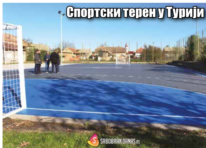
Спортски терен у Турији