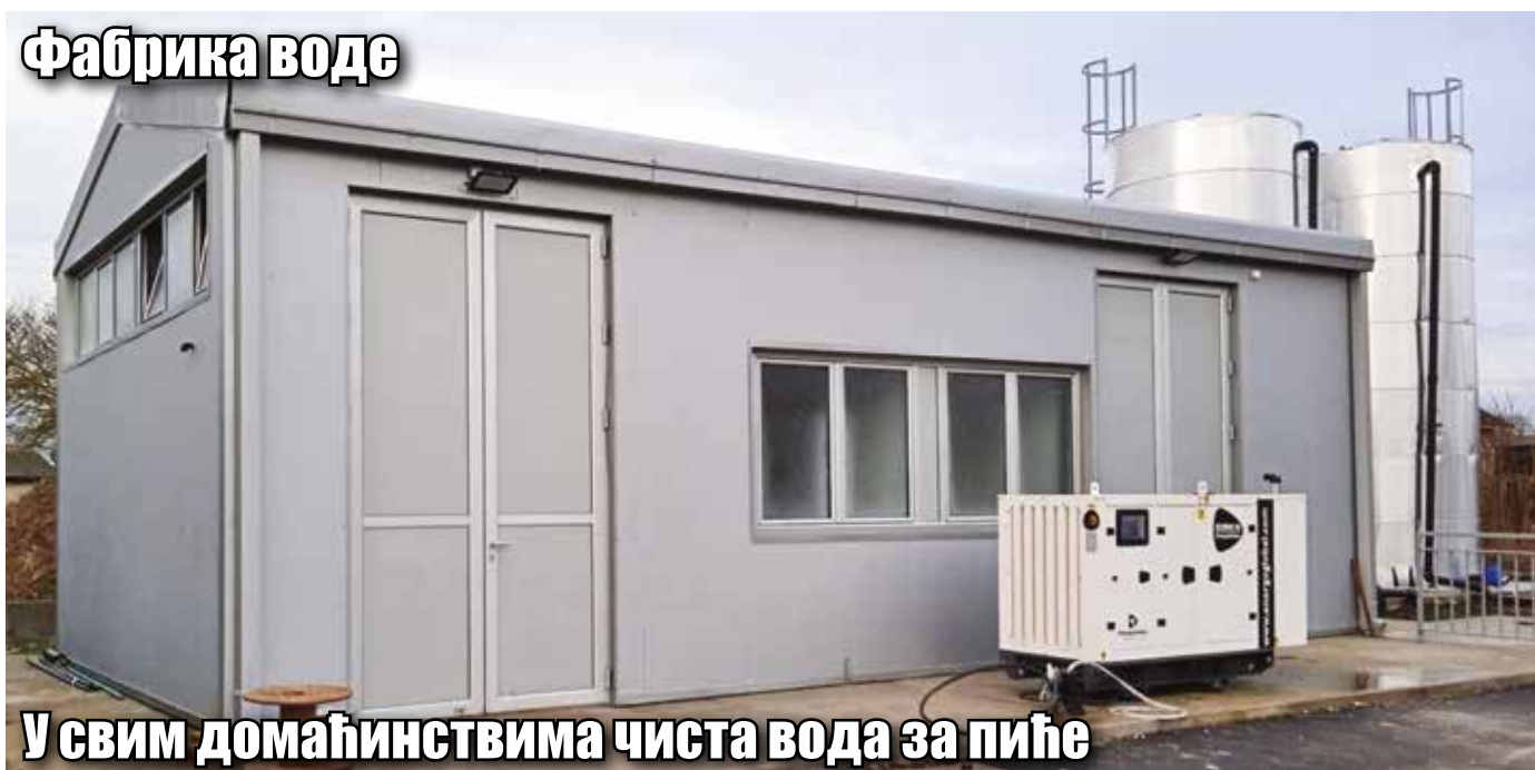
У свим домаћинствима чиста вода за пиће

■ Покрајински секретаријат за пољопривреду, водопривреду и шумарство обезбедио је 40 милиона динара за изградњу фабрике воде у Турији. Уз улагање вредно 15,5 милиона динара за изградњу повезног цевовода, на свим чесмама у домаћинствима у Турији потекла је чиста вода за пиће.