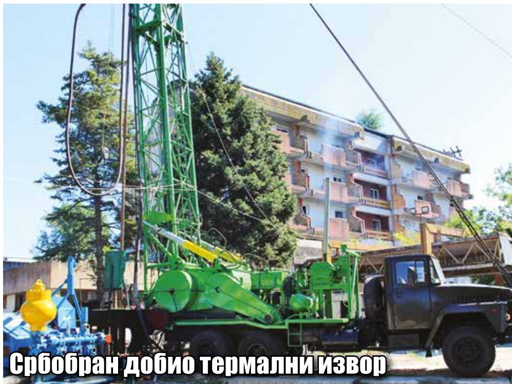
Србобран добио термални извор

■ Након успешне продаје хотела „Елан“ нема дилеме да ће Србобран развијати бањски туризам. Нови власник хотела успешно је окончао бушење бунара термалне воде, извор је показао да је на располагању вода са чак 65 степени Целзијуса, која стиже са дубине од 1.250 метара, што је до сада најдубље избушени бунар у Србији. Када се узме у обзир да су прелиминарни резултати показали издашност од 500 литара у минути, са додатном пумпом то може ићи и до 1.000 литара, основни предуслов за наставак пројекта реконструкције хотела и доградње више базена, спа и велнес центра, лечилишта и рехабилитационог центра, сада је успешно реализован и следе грађевински радови. У току је пројектовање целог центра и прикупљање неопходних сагласности и дозвола и може се очекивати да хотел „Елан“, после више од две деценије поново постане један од заштитних знакова Србобрана. Бањски центар биће шанса и за многе друге породичне бизнис пројекте у оквиру широке туристичке понуде.