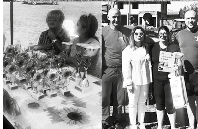
Дух заједништва у Србобрану, Турији и Надаљу