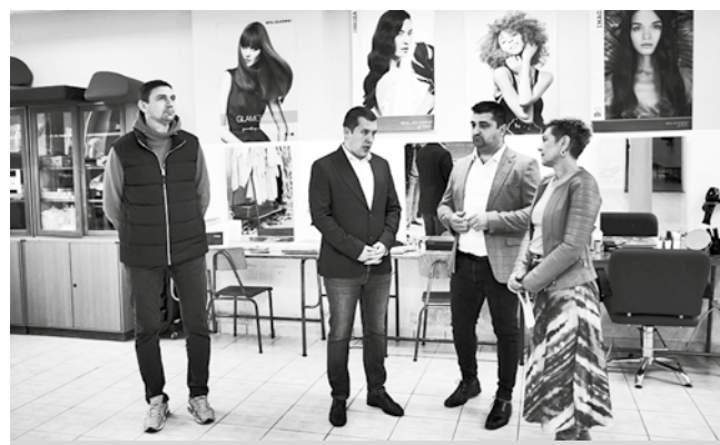
У следећој школској години очекује се 200 ђака