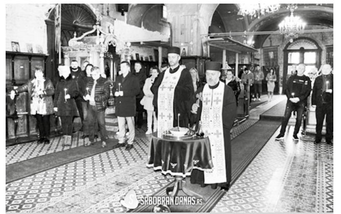
Сећање на дан када је потписано примирје

феникс, јер и када се потпуно осуши - може поново да оживи после кише или мало