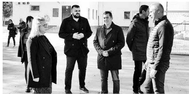
Србобран је ангажована општина

до сада је урађен терен у Турији, такође за рукомет. Водимо рачуна и о мањим срединама и улажемо у сва места у општини Србобран“, истакао је Баста.