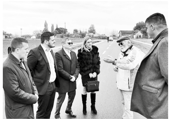
У плану да се комплетна производња фирме „Procesing“ пресели у Србобран