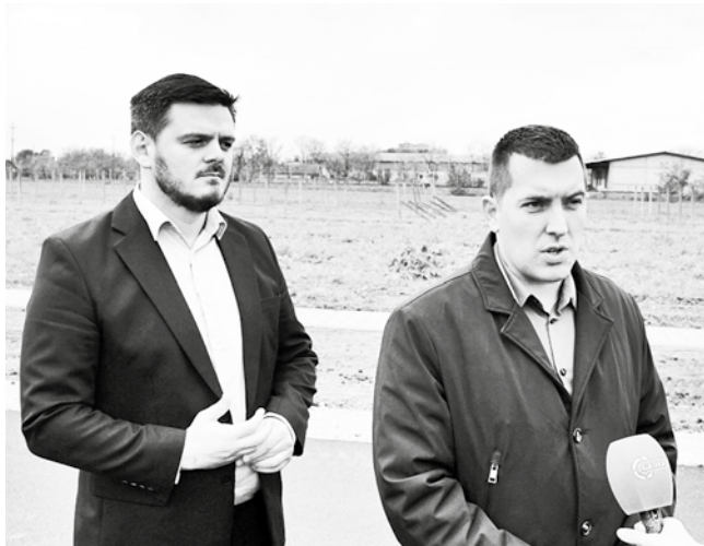
Фирма „Scan Metals“ отвара нова радна места

ако говоримо о општини Србобран имамо 200 нових радних места у истом периоду. Наставком ових пројеката смањићемо број незапосленог становништва, иако смо у си-