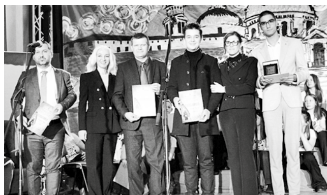
„Ленкино перо“ Тари и Урошу

Покрајински секретаријат за културу, јавно информисање и односе с верским заједницама, а у сарадњи са Матицом српском и Центром за афирмацију културне баштине Дунђерских, прво смо у септембру имали програм у општини Гацко и посетили село Вишњево, одакле