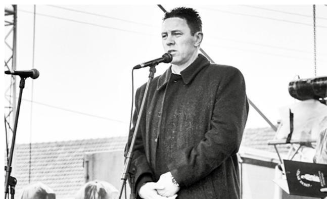
Ознака “Најбоље из Војводине”

Јесте да је због кише изостао концерт Секе Алексић, али то није спречило да се