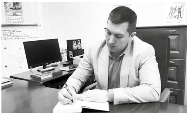
Социјална заштита, образовање, култура...

живота. Трудимо се да ниво комуникације сведемо на ниво човека са човеком, а не разговор грађанина са влашћу. Уважавамо свако обраћање, свако питање и сугестију и пажљиво слушамо шта нам поручују и на чему инсистирају грађани. Неке ствари се могу решити одмах, за неке је потребно време, али је важно да имамо идеје и визије како да доносимо одлуке да се то све реши. Чини ми се да смо у сваком сегменту покренули одређене пројекте који су или почеци или чак завршеци решавања неких вишегодишњих или вишедценијских проблема. Дом културе је затворен око две дценије, хотел исто тако, улице нису реконструисане стварно дуги низ година, а слично је било и у неким другим областима. У решавање ових проблема ушло се, између осталог, и након разговора и указивања грађана на ове ствари. Као председник општине са сарадницима два пута недељно разговарам са грађанима, одлазимо у насељена места са овом намером, не чекамо грађане у нашим канцеларијама. Нама сугестије које чујемо много значе и на основу њих креирамо политике. Живимо у овом месту, као грађанин и сам размишљам шта бих сугерисао председнику општине, јер на исти начин као и сви други, желим да се развијемо.