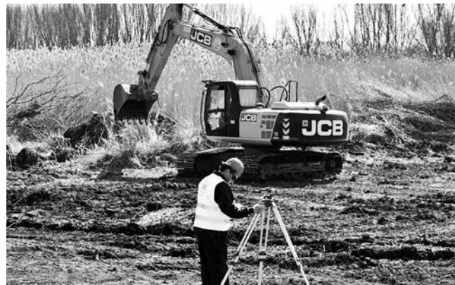
„Воде Војводине“ улажу 4 милиона евра

лазе кроз Турију замолили за стрпљење, радови нису једноставни, али ће ускоро добити најмодернији главни пут кроз село. Када томе додамо наше радове на реконструкцији