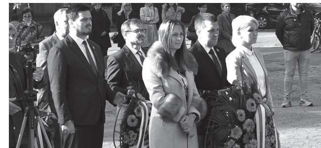
Положени венци на споменик на Тргу слободе

рише, и треба да се зна да никада нећемо дозволити тако нешто и борићемо се да буде трајно искорењен. Исказујемо велико поштовање према палим борцима и жртвама фашизма и нацизма, као и свим жртвама из ратних сукоба који су задесили наш народ током деведесетих година. Нажалост, и Надаљ, и Турија,