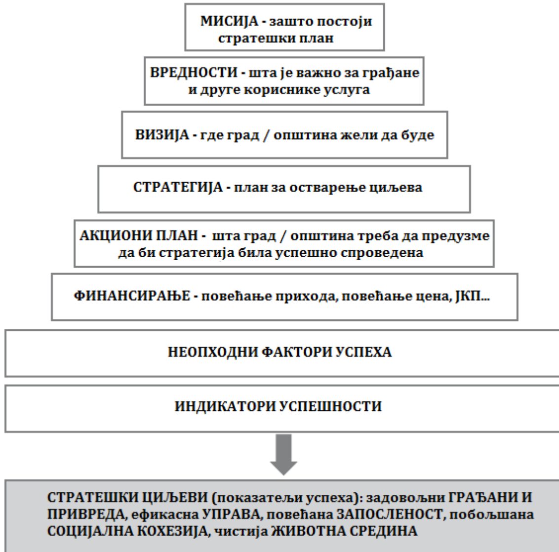
Слика 2. Логична повезаност кључних елемената стратешког плана

Посебно важан, виталан сегмент у моделирању изведених акционих планова било је повезивање оперативних задатака са буџетским оквиром. Финансијске пројекције и буџетске операције омогућиле су идентификацију ресурса (интерни, локални, национални, међународни, у партнерству са приватним сектором, итд) и коришћење средстава. То истовремено укључује и упутства за алокацију средстава и трошење, као и за развој временског оквира на основу потреба акционог плана. Заједничка процена могућности и финансијских пројекција ће помоћи заједници да изврши приоритизацију пројеката на основу финансијске изводљивости.