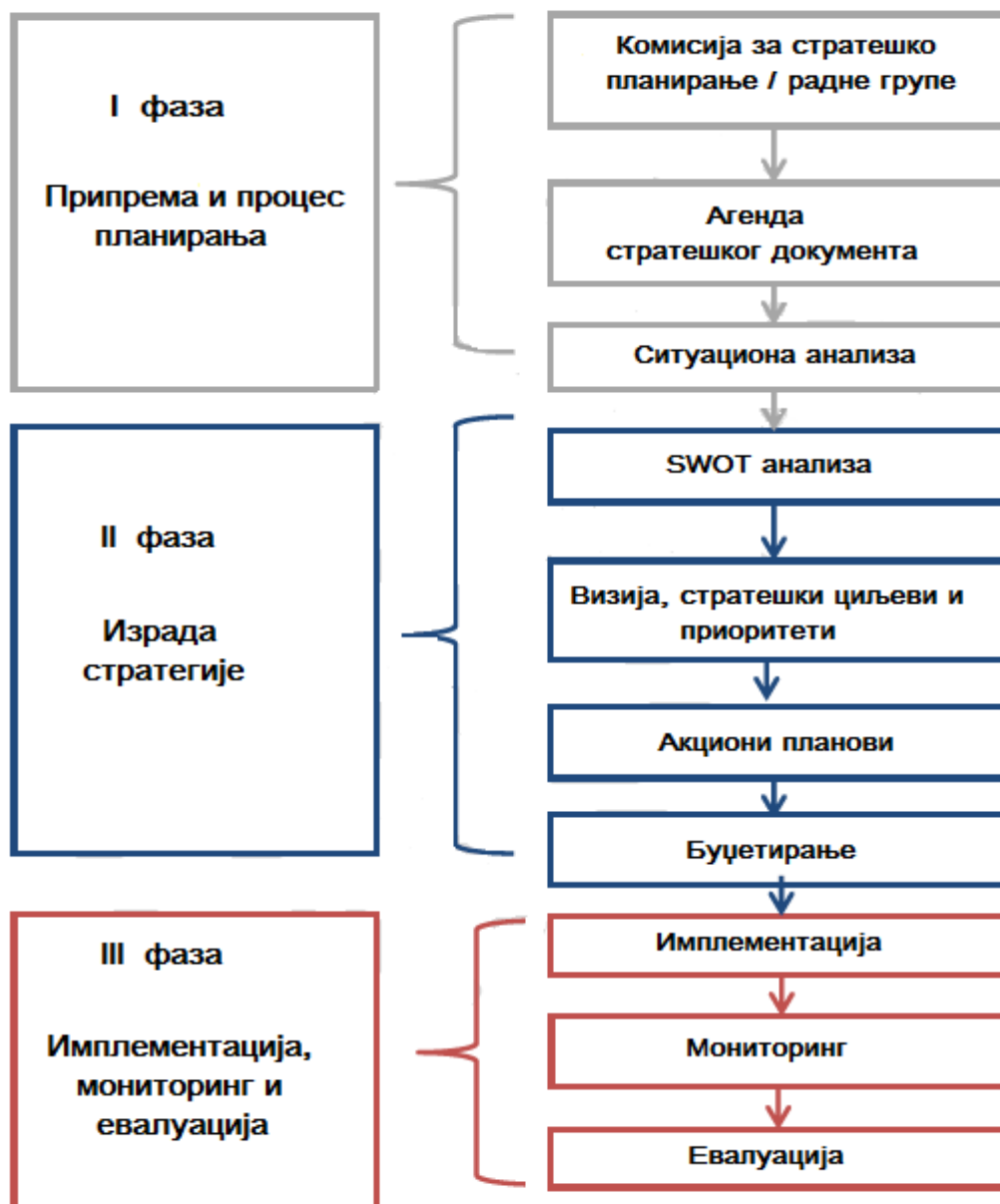
Слика 1. Кључни кораци и фазе у моделирању стратешког развојног документа

Прва фаза ( припрема и процес планирања ) била је посвећена обезбеђењу политичке посвећености, идентификовању актера који ће учествовати у стратешком процесу,